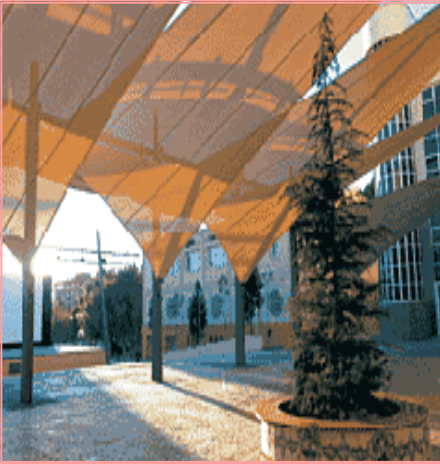
Instituto Municipal de Cultura y Juventud

En esta sección os daremos información sobre los servicios que ofrece el Ayuntamiento, haciendo especial mención de aquellos que son nuevos, y que necesitan ser puestos en conocimiento de los ciudadanos.