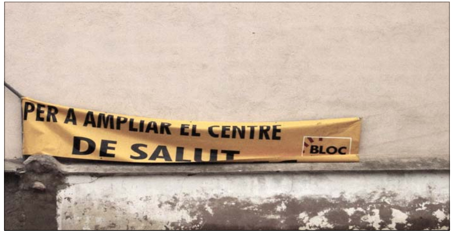
Pancarta del BLOC a la façana del Centre de Salut

A les darreres eleccions municipals, el BLOC es va presentar com la nova esquerra nacionalista, alternativa progressista als votants del nostre poble. Tan mateix, fa poc, en Bonrepòs i Mirambell, varen presentar moció de censura conjuntament amb el PP , configurant el nou govern, on el Bloc donà l'alcaldia a la dreta, seguint d'ara endavant les directrius d'aquesta a les polítiques locals.