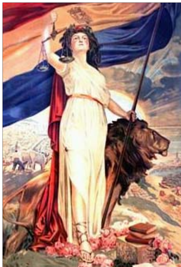
Cartel de la Segunda República Española

El presidente de la Asociación invita a participar y a conocer la actualidad política de la sociedad, así como colaborar en las actividades y actos que realizan.